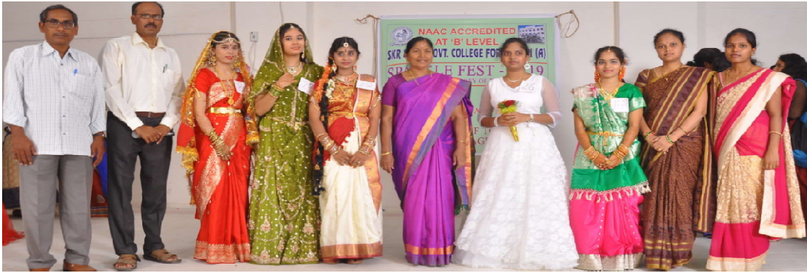
FANCY DRESS COMPETITION WINNERS WITH PRINCIPAL

As per the principal madam Dr.P.Subbalakshamma instructions our college students participated in “SPARKEL FEST” .It was Organized by “SKR&SKR GOVT COLLEGE FOR WOMEN(A), Kadapa”.