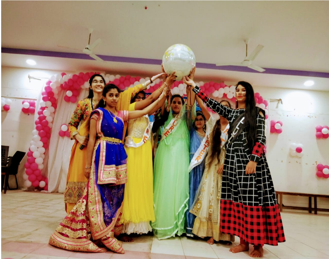
Theme based fashion show

Theme: Nature, the creature. Save it for the Future