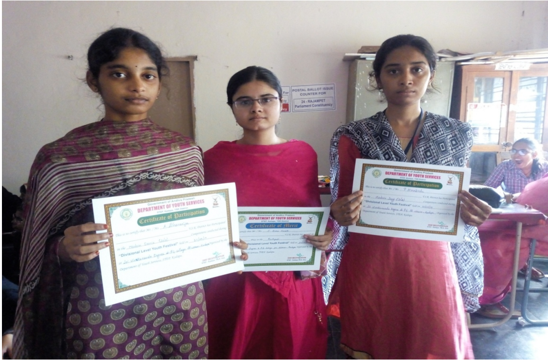
Students showing their participation certificates