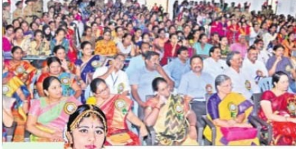
హాజరైన విద్యార్థినులు, అధ్యాపకులు