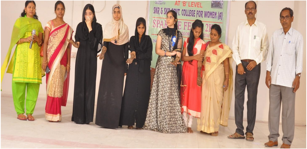
MEHANDI COMPETITION DURING THE FEST