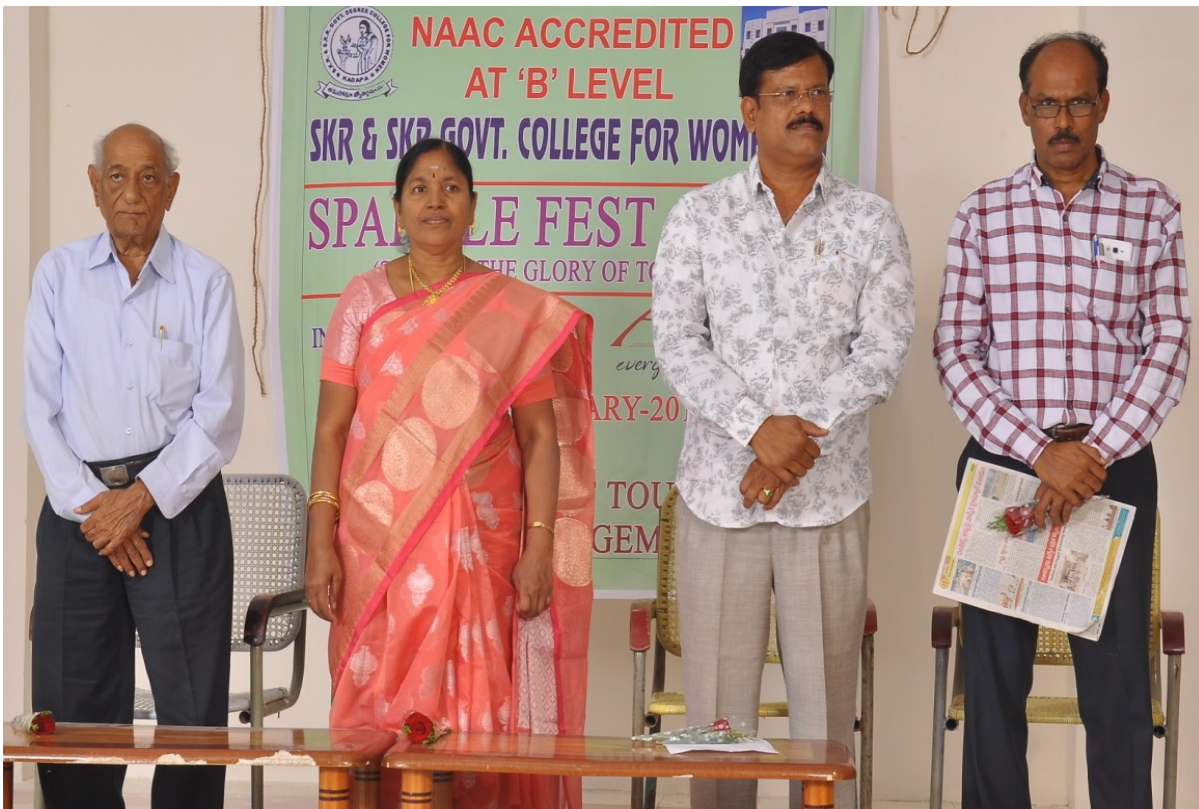
GUESTS FOR THE FEST ALONG WITH PRINCIPAL