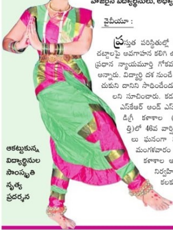
అకట్టుకున్న విద్యార్థినుల సాంస్కృతిక సృష్టి ప్రదర్శన