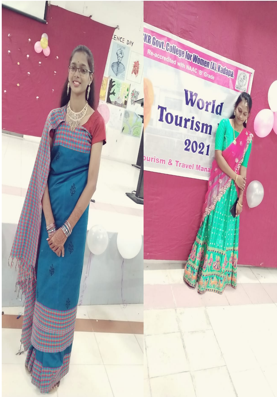
Fancy dress competition winners