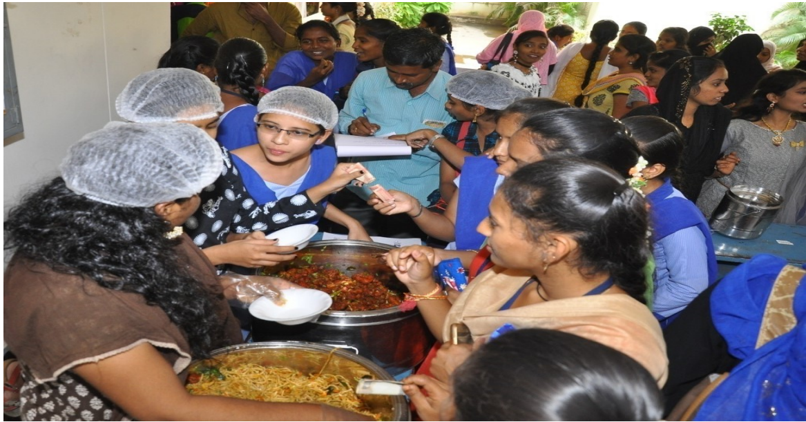
Food Fest Celebrations