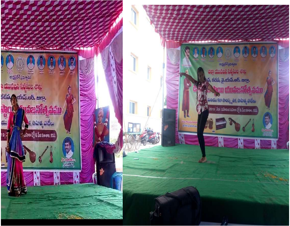
Modern Dance solo performed by our students