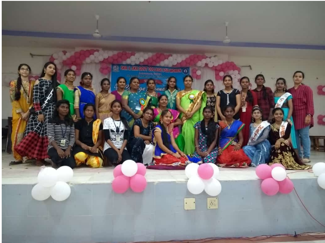
Participants with cultural head and Principal