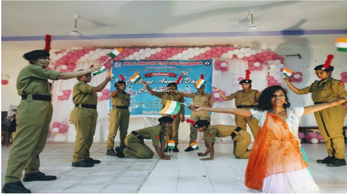
Dance with the concept of Patriotism