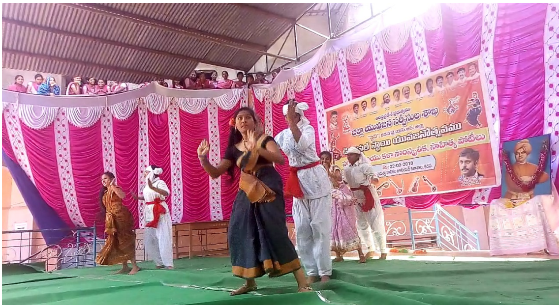
Folk dance performance