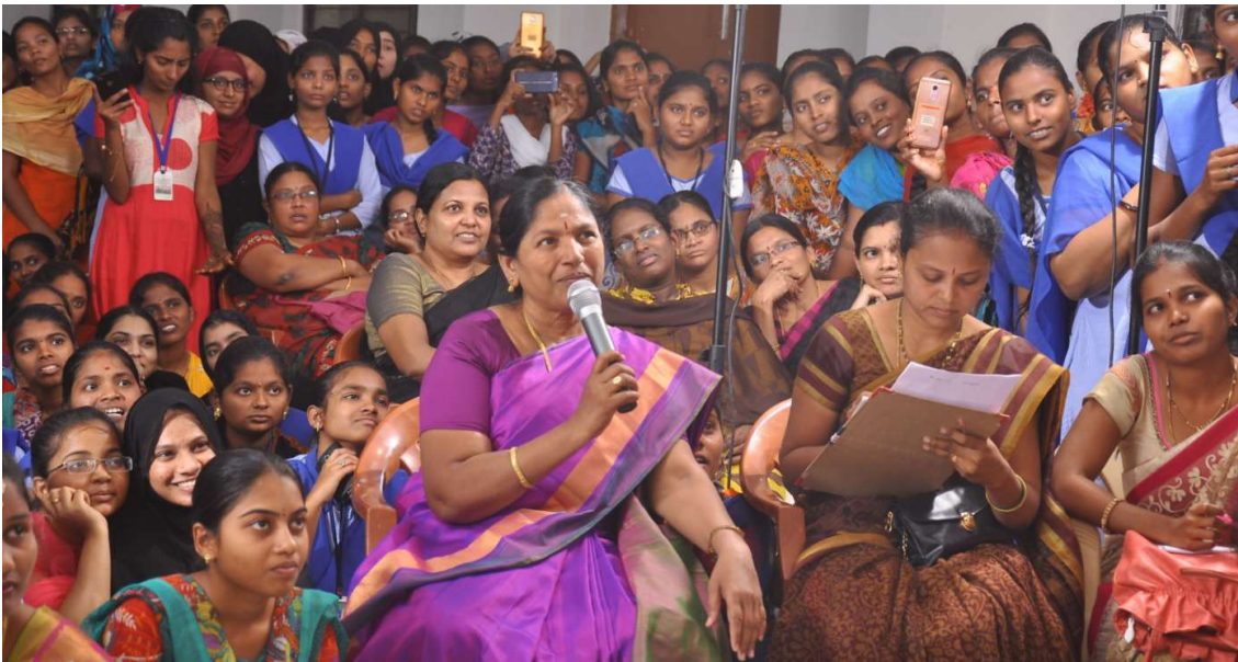
DURING THE FEST